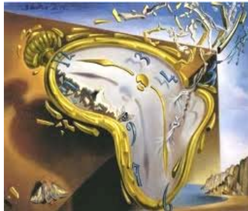
(Pintura surrealista “El reloj”, S. Dalí)

Nace en Francia, después de la primera guerra mundial, y con la influencia de la teoría psicoanalítica, André Bretón dirigió un grupo que buscaba nuevas expresiones, e intentaban por medio de la hipnosis crear o escribir sobre algo nuevo, hasta que en 1924 Bretón lanzó “el manifiesto surrealista”, reclamaba el derecho de alcanzar la surrealidad que tenía una visión más profunda de la realidad, era muy agresivo, ya que desconocía todo arte existente y pedía sabotear a toda regla existente. El surrealismo pretendió transformar al hombre y a la sociedad. Es un movimiento que marcó este siglo. En literatura se hace “la escritura automática”, ya que no se respetan reglas gramaticales, se hacen las creaciones colectivas, el precursor es Guillermo Apollinaire y su mayor exponente es Bretón. Giorgio de Chirico es el precursor del surrealismo pictórico. El surrealismo entra en todas las artes, descubriendo el mundo subconsciente, la primera película surrealista fue “la estrella de mar del pintor Man Ray”. Del director Luis Buñuel y con Dalí realizaron “La edad de oro y un perro andaluz”.