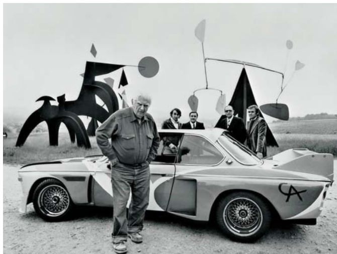
(Fotografía de Alexander Calder, móviles)

En 1920, llegan nuevos materiales y técnicas en movimiento, nace el arte cinético, representado por Alexander Calder, que creó los móviles, que consiste en varillas delgadas y hojas metálicas de distintas formas, se mueven con pequeños motores y/o con el viento.