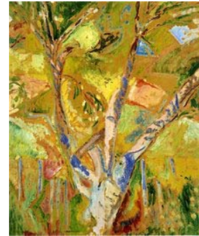
(Pintura de Alfred Henry Maurer, “Provenza”)

Otros artistas fauvistas son; Maurice de Vlaminck, André Derain, Paul Gauguin, Gustave Moreau, Roault, Jean Puy.