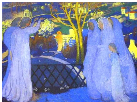
(Maurice Denis, “Femme au tombeau”)