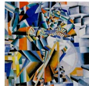
(“Serpiente robot”, Casimir Malevich)

Surgió en Rusia, por Kasimir Malevich, eliminó toda alusión a los objetos, todo condicionamiento religioso, político y social, se alejó de las demás vanguardias. En este movimiento se enfocaron las formas geométricas, había una sociedad de artistas dirigida por Malevich y estaban integrados Liuvob Popota, El Lizzitsky, Alexander Rodchenko.